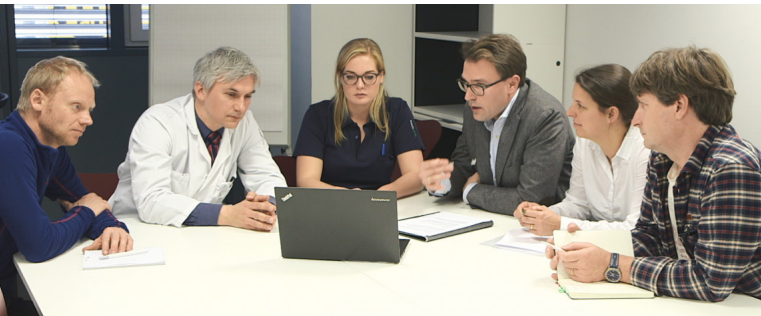
Fig. 1: Un audit clinique est une expertise réalisée par des confrères indépendants (en général un médecin, un physicien médical et un technicien en radiologie médicale) ayant pour but d'assurer une utilisation optimale des rayonnements ionisants.

informé du contenu du rapport qu'en cas d'écarts significatifs par rapport aux dispositions légales en matière de radioprotection.